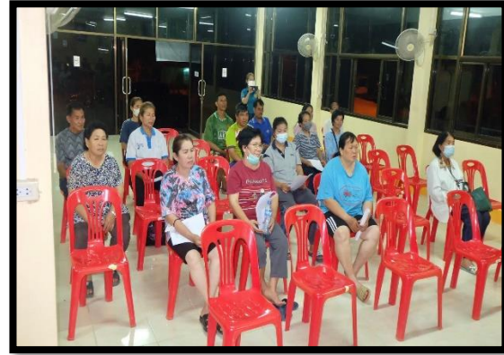
หมู่ที่ ๖ บ้านพุทไธเร วันที่ ๘ ธันวาคม ๒๕๖๖ เวลา ๐๙.๐๐ น.