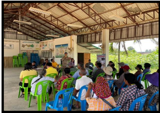
หมู่ที่ ๔ บ้านหนองหญ้าปล้อง วันที่ ๑๒ มีนาคม ๒๕๖๗ เวลา ๑๗.๐๐ น.