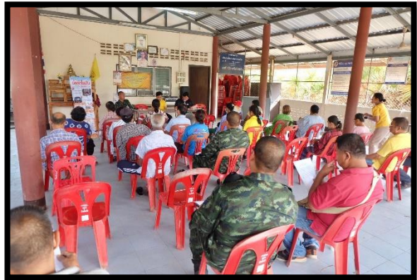
หมู่ที่ ๑๐ บ้านสระสี่มุม วันที่ ๖ ธันวาคม ๒๕๖๖ เวลา ๑๘.๐๐ น.