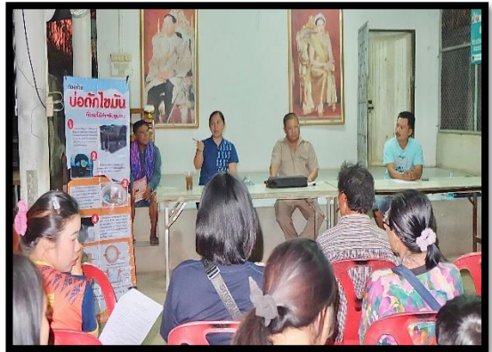
หมู่ที่ ๘ บ้านสะแกงาม วันที่ ๑๒ มีนาคม ๒๕๖๗ เวลา ๑๘.๐๐ น.