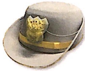
หมวกแก๊ปทรงอ่อนพับปีก (หญิง)