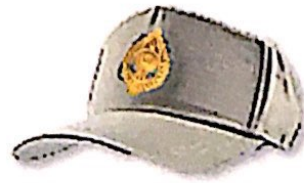
หมวกแก๊ปทรงอ่อน แบบ ๒ (ชาย)